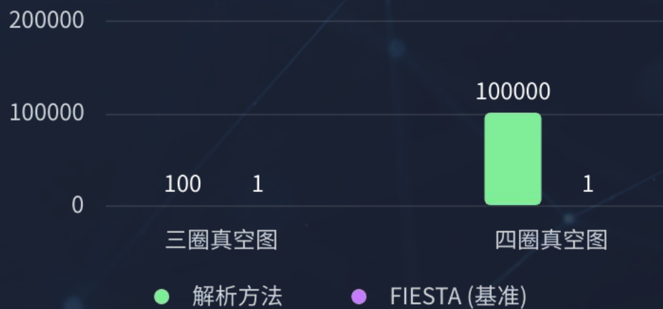
计算速度提升倍数

解析方法展现出压倒性效率优势，显著降低计算耗时，为大规模、高精度的物理计算提供了关键工具。